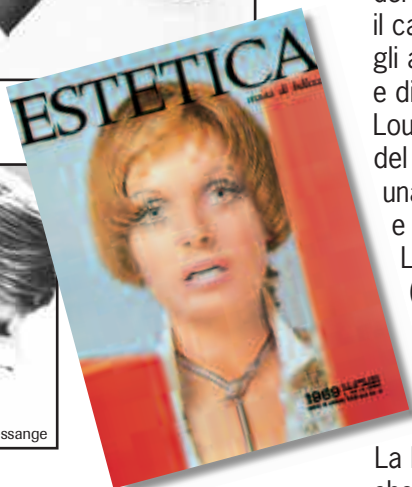
In alto, una copertina di Estetica del 1969 e due proposte carré dello stesso decennio.