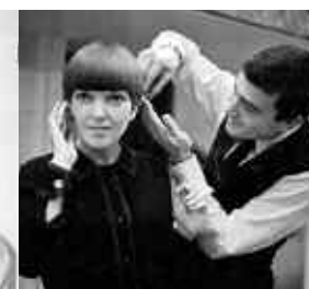
A destra e in alto, Vidal Sassoon e due sue creazioni.